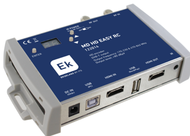
MD HD EASY RC