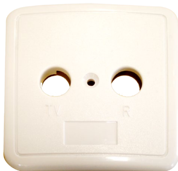
MTB Marco para toma